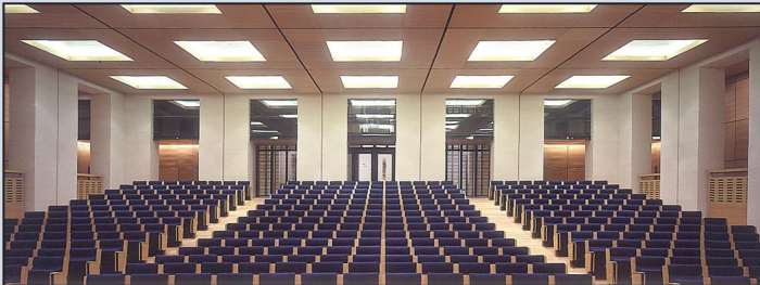
Tranche 1