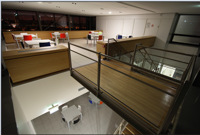
Tranche 2 / photos © Jacques FERRIER architectures